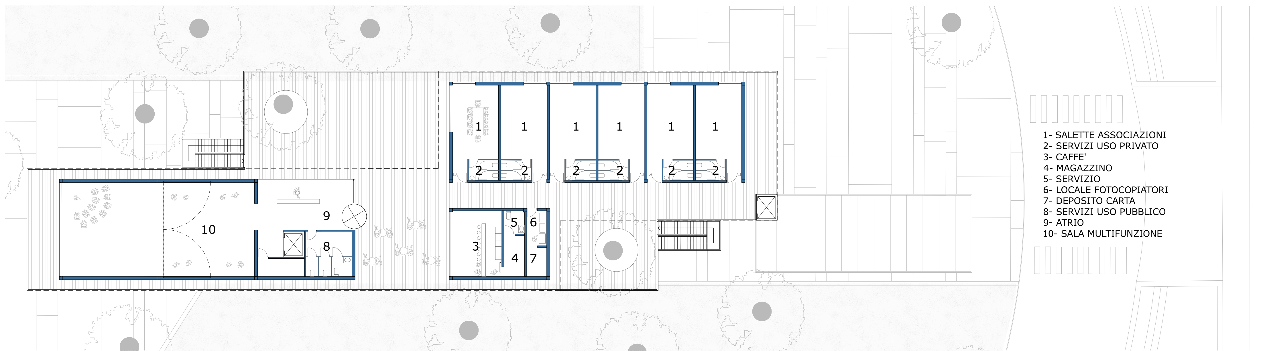
ESTRATTO PLANIMETRIA AREA GIARDINI CON NUOVO EDIFICIO: PIANO PRIMO