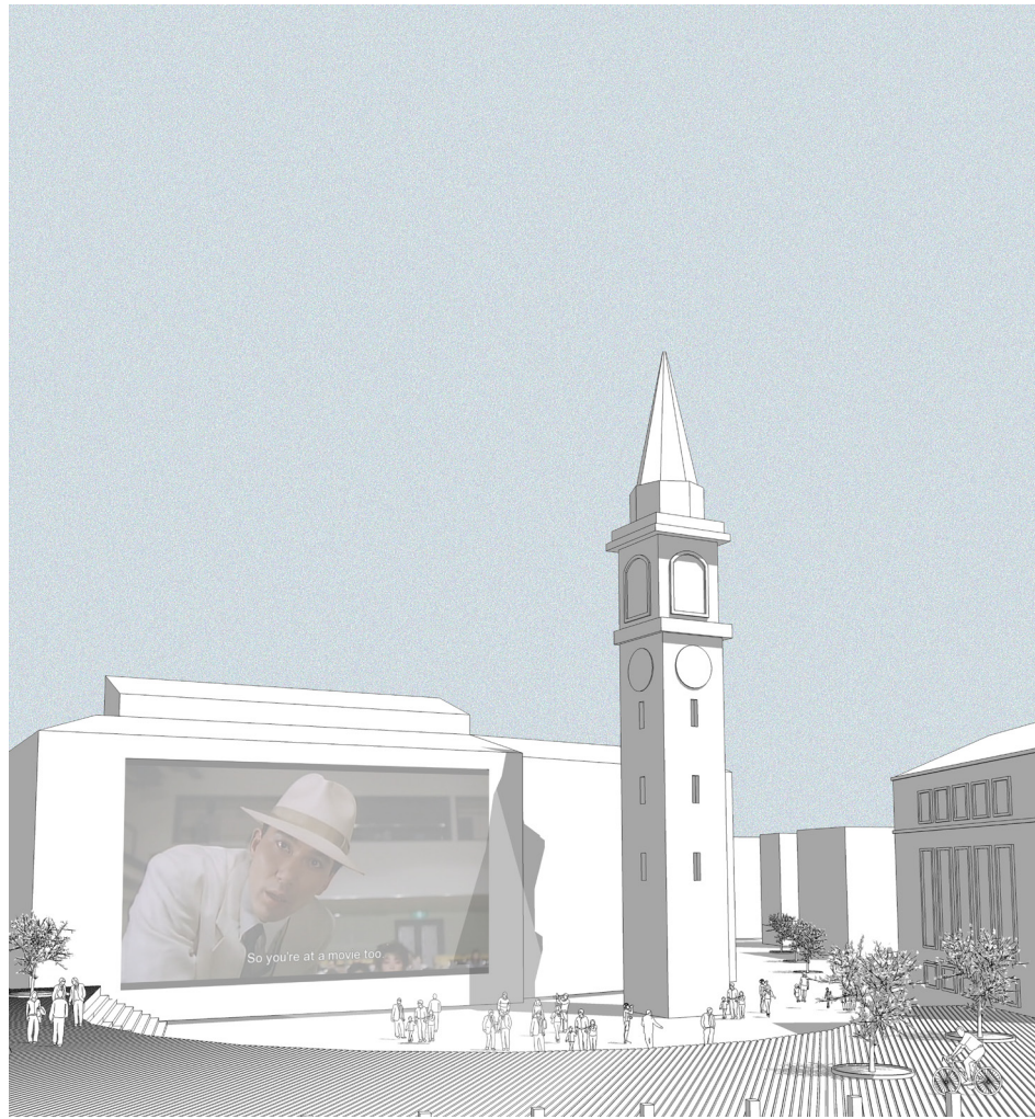
Prospettiva dal anfiteatro