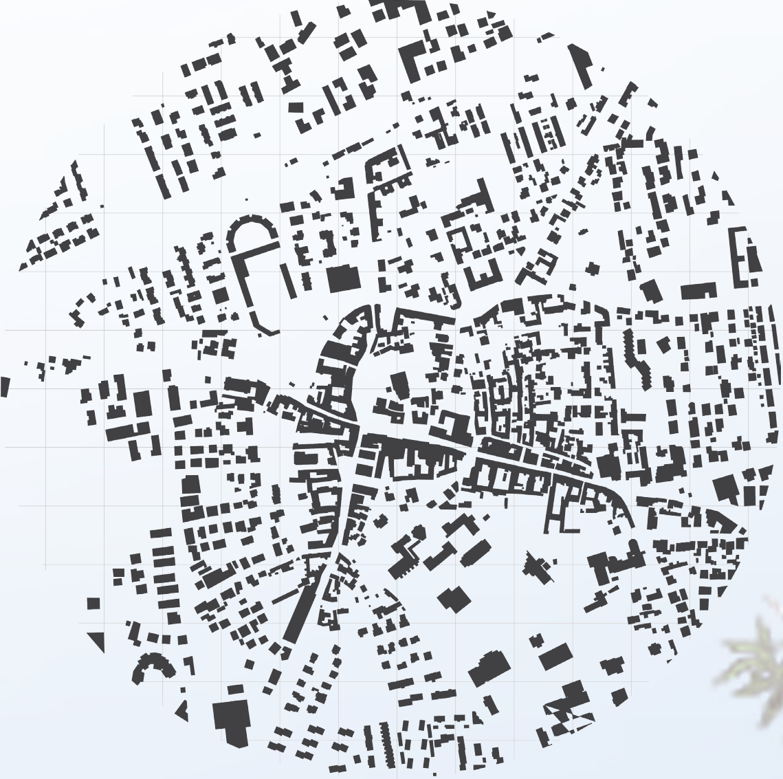
Layer 03 - schwartzplan