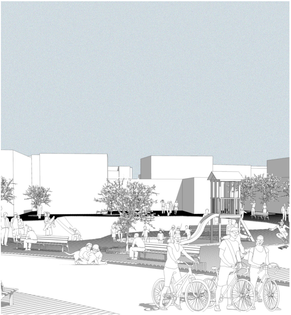
Prospettiva dal skatepark