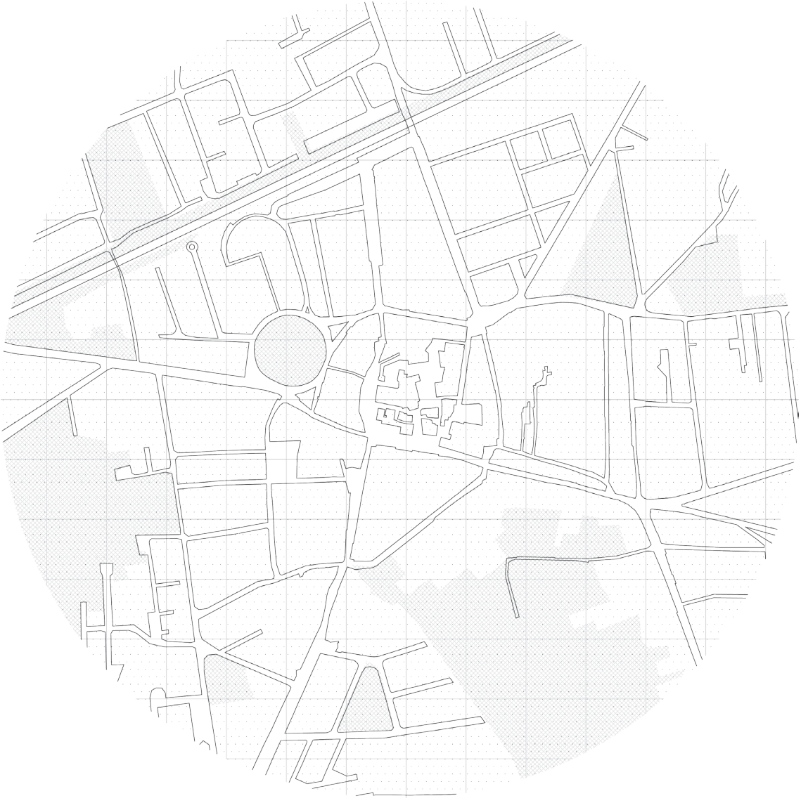
Layer 01 - spazi verdi