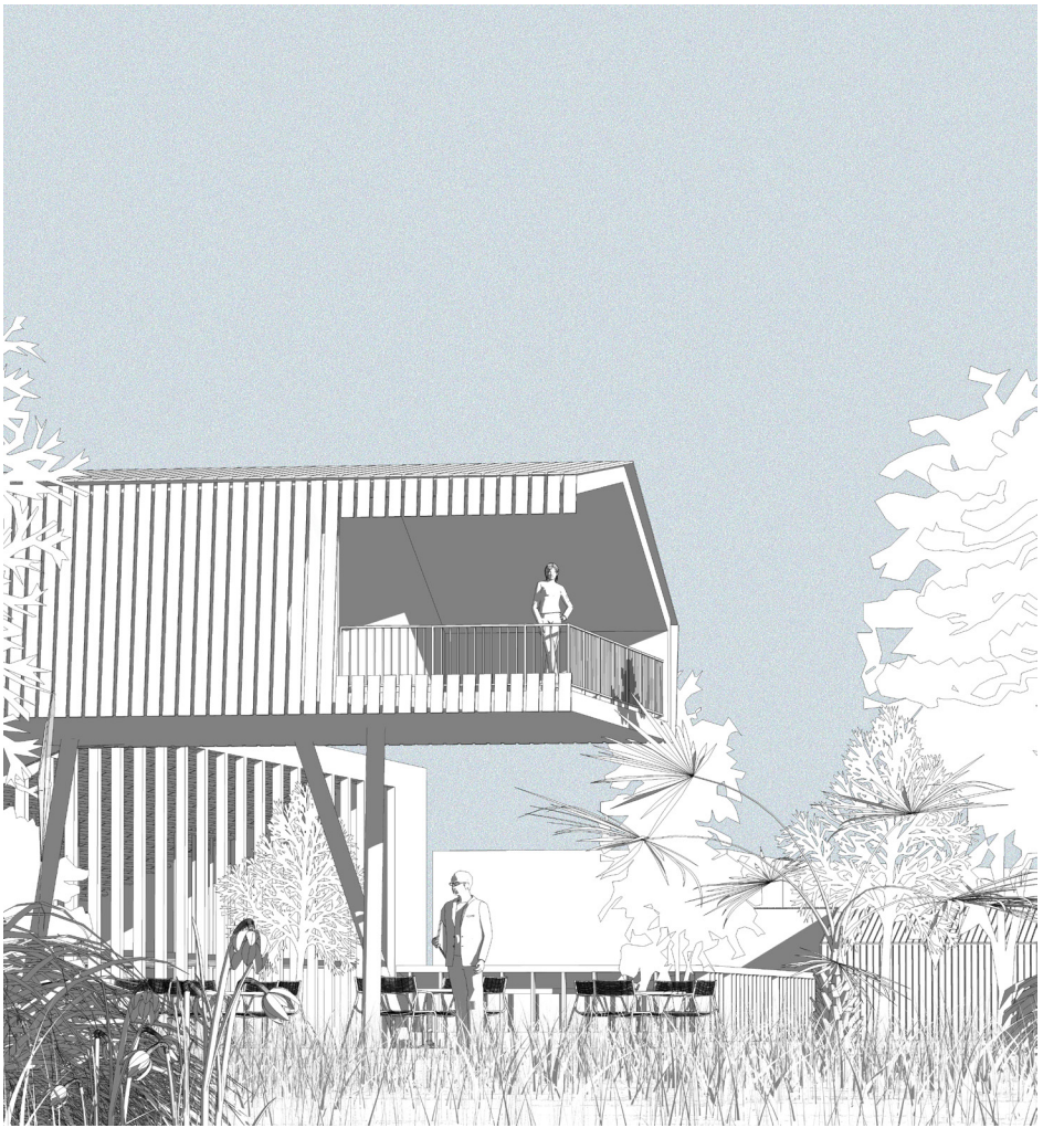
Prospettiva dal parco

PROGETTO: La soluzione architettonica per Codroipo