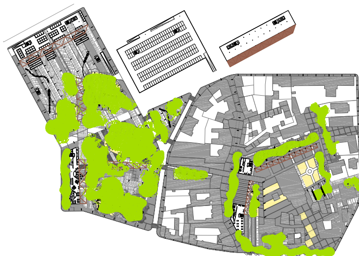
PLANIMETRIA DELLA PIAZZA - MERCATO

L'area si organizza a partire da esso e del nuovo edificio pubblico che proponiamo nella parte sud-ovest dal quale si sviluppa, nella parte interiore, un secondo ambito pubblico.