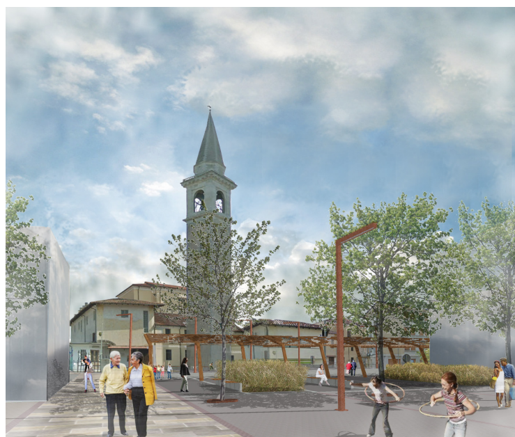
VISTA FRONTALE PIAZZA DEL DUOMO