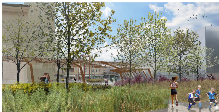
VISTA LATERALE PIAZZA DEL DUOMO

I pavimenti saranno prevalentemente di pietra naturale con alcune parti in lastre di cemento e le zone per la circolazione veicolare in asfalto. Alcune aree dalle geometrie più morbide e irregolari saranno destinate per la vegetazione con alberi e alcuni piccole distese di prato.