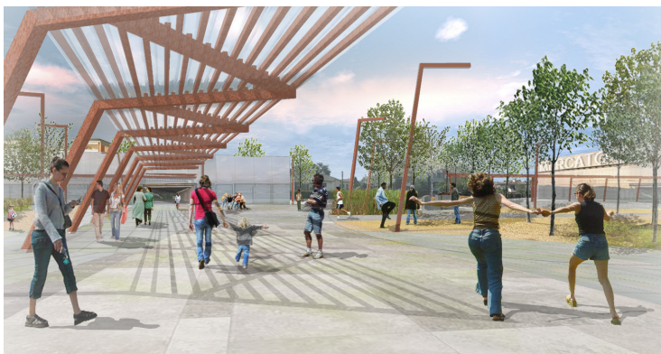
VISTA DELLA PIAZZA-MERCATO

Si tratta di stabilire relazioni tra gli edifici del punto centrale della città, comune, chiesa, edifici pubblici e il nuovo spazio pubblico definito dal nuovo mercato e dall'edificio del bordo sud-ovest dello stesso.