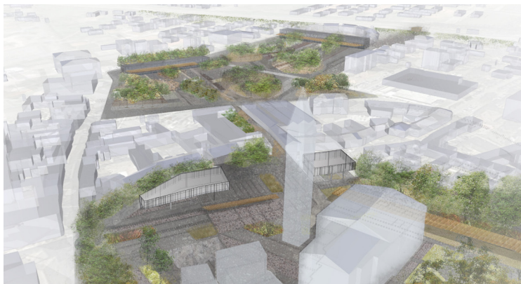
VISTA GENERALE DELLA PIAZZA

Si tratta di stabilire geometricamente delle linee di riferimento tra le parti che entrano in gioco in quest'area così da dotarla di un significato unico.