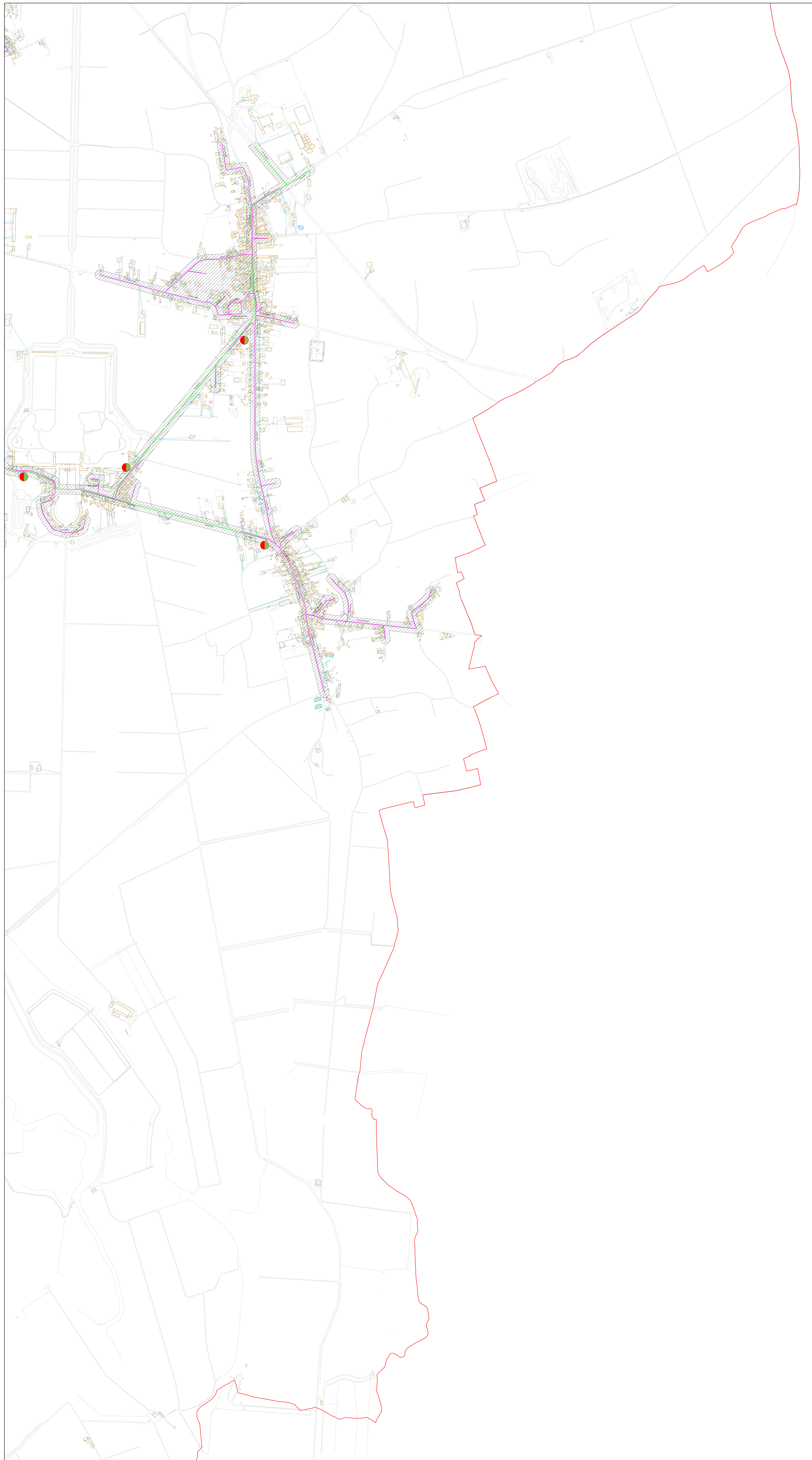
Tavola n° 4: Rilievo della numerazione civica sovrapposto alla delimitazione delle aree metanizzate

Redazione dello stradario informatizzato dell'Associazione Intercomunale Medio Friuli