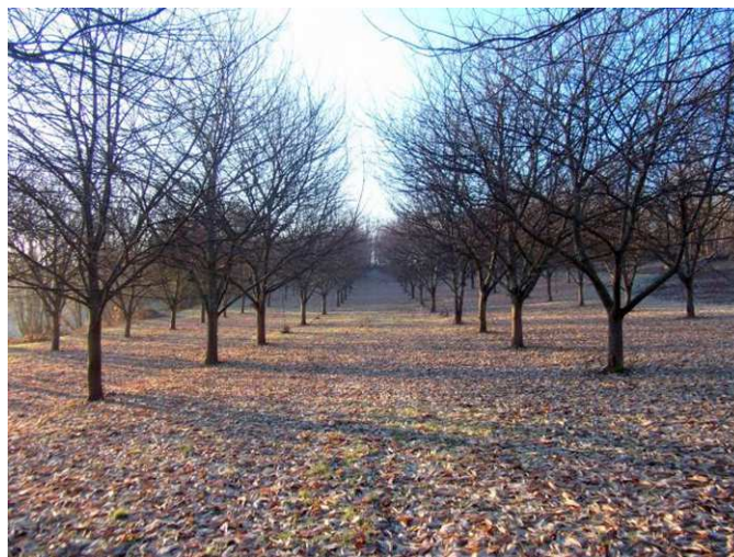
Esempio di castanicoltura intensiva

In altre regioni italiane dove la castanicoltura è di tipo intensivo ed i castagneti sono degli impianti di frutticoltura specializzati si è in molti casi proceduto con lanci di un parassitoide ( Torymus sinensis ), anch'esso di origine cinese.